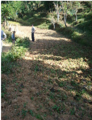
Aan de linkerkant van de weg 2 terrai's

Inmiddels is er grond aangekocht, zijn de tekeningen gemaakt, is de eerste steen gelegd en de registratie is gedaan bij het district zodat de school ook erkend is.