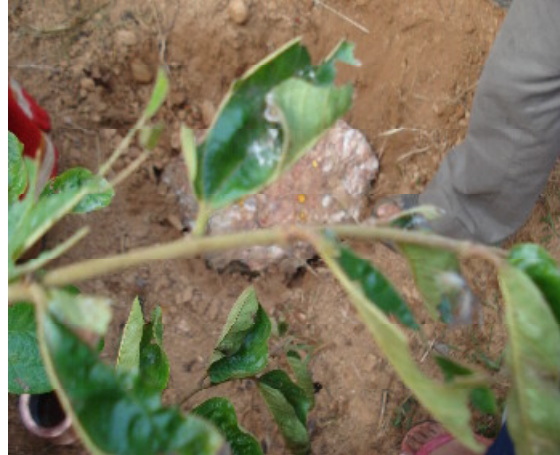
De eerste steen is gelegd.

Afgelopen jaar hebben 8 kinderen de mogelijkheid gekregen, van u als donateur, om naar school te kunnen gaan.