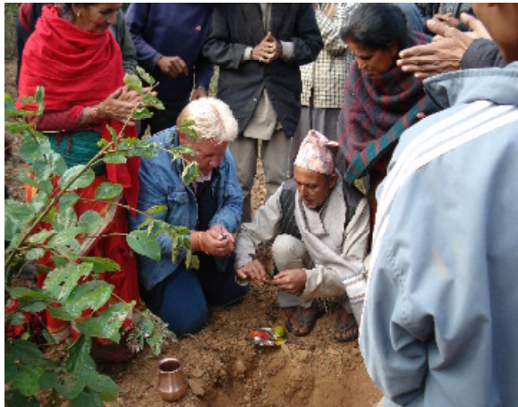
Ceremonie om de eerste steen te kunnen leggen.

Afgelopen november verbleef ik voor vijf weken in Nepal waaronder in Nalang waar we de eerste steen hebben gelegd voor de start van de bouw van de school.