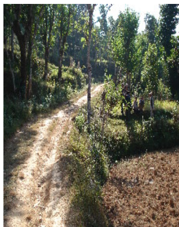
In het midden loopt een weg.